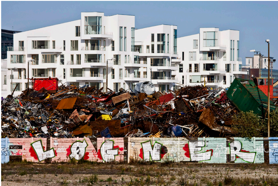
"Havneholmen set fra Enghave Brygge, tirsdag d. 6. oktober 2009, kl. 14:30", Kontraframe, 2009. 20 Hvis der ikke er mennesker på billederne, er der spor efter dem: nogen har skrevet "løgner" med store bogstaver – en tekst, der sætter tanker i gang: Hvem har skrevet det? Hvilken løgn og hvilken løgner er der tale om?