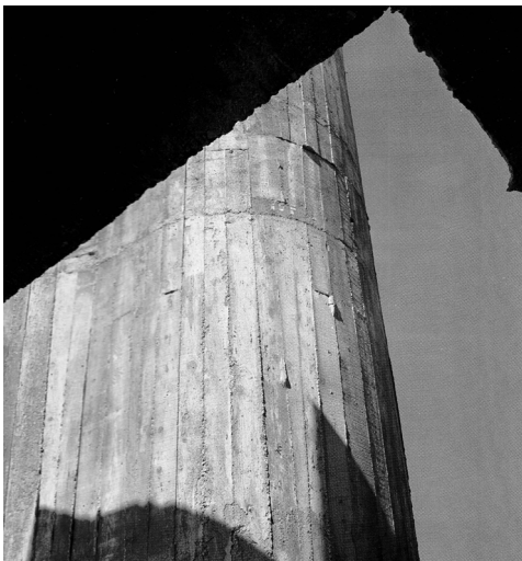
Unité d'Habitation, arkitekt Le Corbusier, fotograf Lucien Hervé, 1949. 10 Et næsten ikonisk eksempel inden for arkitekturfotografi er Lucien Hervé, der var Le Corbusiers foretrukne fotograf. "Sir, you have the soul of an architect", skrev Le Corbusier i et brev til Hervé i 1949. 11