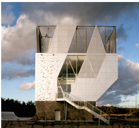
Herstedlund Fælleshus, arkitekt Dorte Mandrup Arkitekter, 2010. 12 Et typisk, nutidigt arkitekturfotografi fundet i et tilfældigt nummer af Arkitektur DK. Bygningen præsenteres med grafisk styrke, men uden liv.

det klassiske arkitekturfotografi, hvor billederne er meget smukke og stærke i deres grafiske virkemidler og fokuserer på form, linjer, stoflighed, lys og skygge – selvfølgelig ikke overraskende i et fag, der netop arbejder med disse ting.